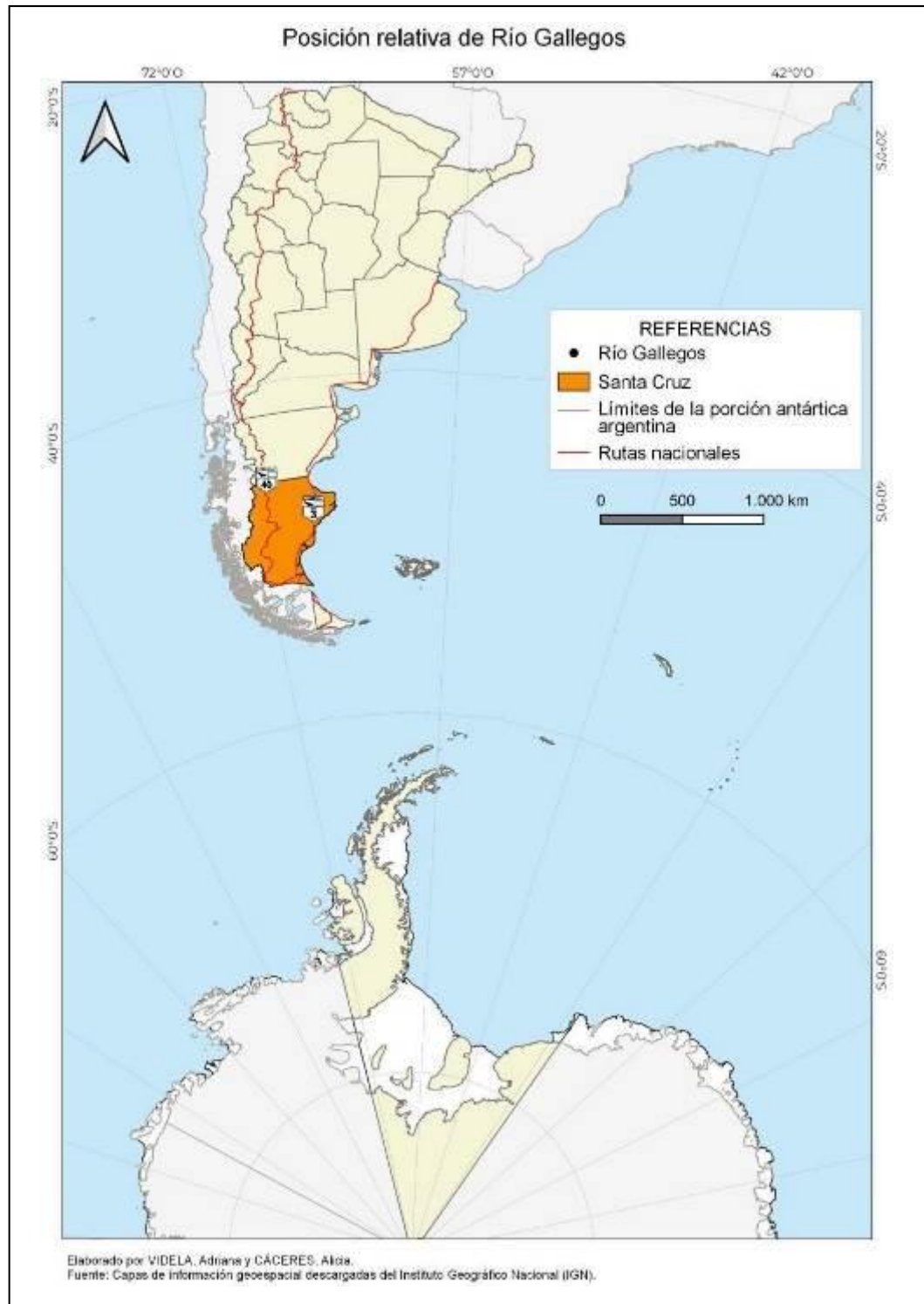
Fig.1. Posición relativa de Río Gallegos. Elaborado por Videla, A. y Cáceres, A.P.

ciudad de Punta Arenas, en la provincia chilena de Magallanes (Fig. 1). Es una ciudad no primada en proceso de metropolización, con equipamiento de servicios e infraestructura suficiente, que la definen como ciudad intermedia (Cáceres et al, 2016:51).