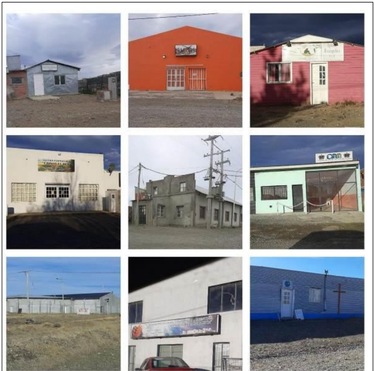
Figura 4: Registro fotográfico tomado en salidas informales. Fila N°1 de izquierda a derecha: Iglesia Evangélica Cristo El Camino, Iglesia Cristiana Hijos del Altísimo Cristo toma tu lugar, Iglesia Evangélica C.C.R.- Fila N°2 de izquierda a derecha: Iglesia Evangélica Cristo el Rey, Iglesia Asamblea de Dios, Iglesia Evangélica Cumbre de los Milagros- Fila N°3 de izquierda a derecha: Iglesia Cristiana Auditorio Bet El, Iglesia Pentecostal Unida de la Argentina Tiempos de Conquista, Ministerio Evangélico Pueblo de Dios.

Finalmente, se han considerado los principales aportes teóricos de la Geografía cultural y de la Geografía de las religiones para este estudio. Con relación a la primera, la religión es uno de los componentes principales de la cultura y está forja identidades; da sentido a la existencia tanto del individuo como al grupo. También es la cultura una influencia en la modificación de los paisajes, ya que cada grupo social contribuye a modificar el espacio que utiliza al tiempo que graba las marcas de su actividad y los símbolos de su identidad. De la Geografía de las religiones, se considera que las acciones y las convicciones motivadas espiritualmente juegan un papel importante en los asuntos humanos, las creencias y los comportamientos religiosos